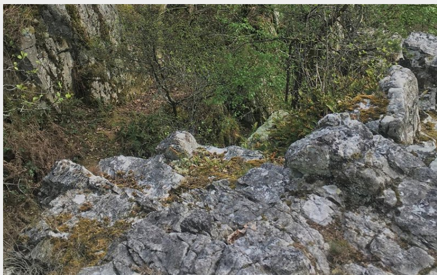
Rocher de l'Ermitage - Station de Trail® Bagnoles Normandie (Tourisme 61)