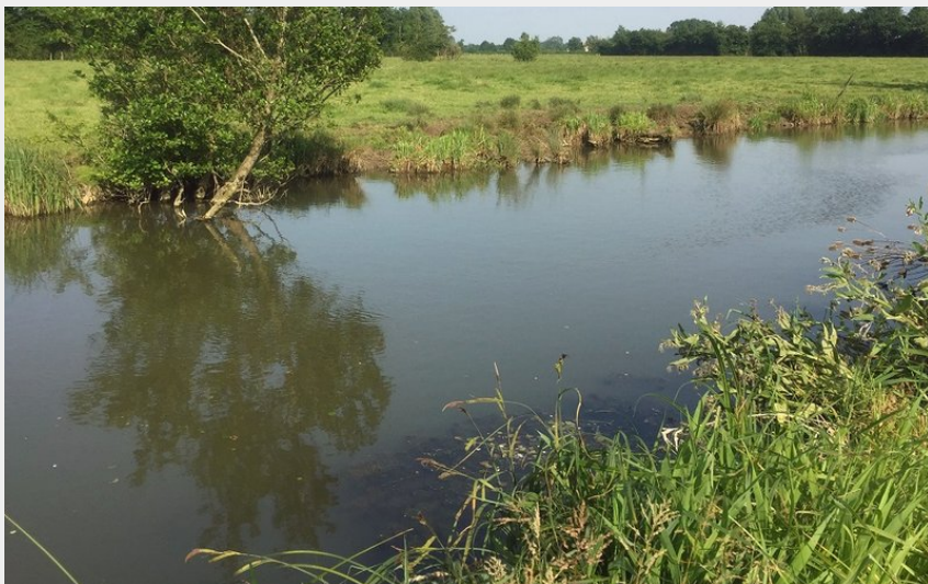
Les Pâtures à Argentan, Espace Naturel Sensible de l'Orne