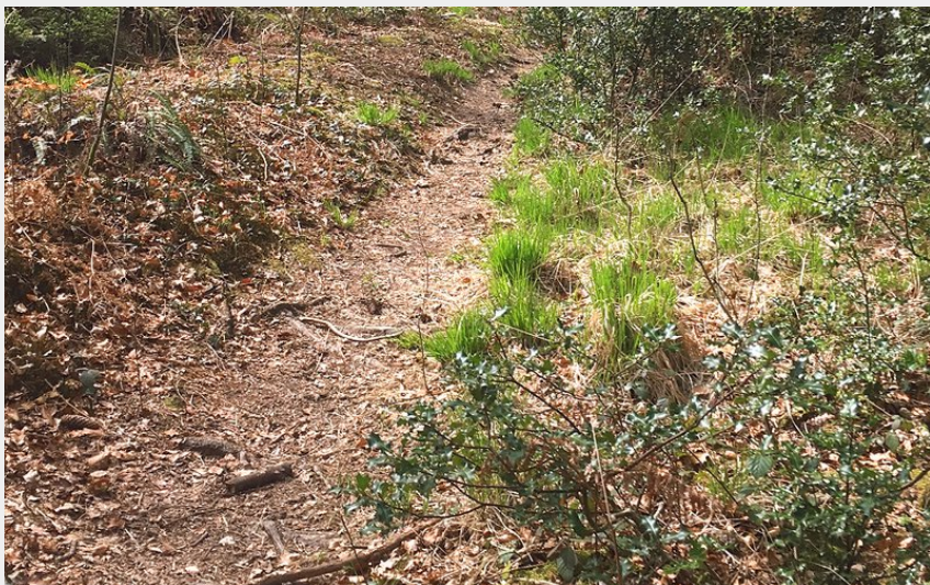
Sentiers de la forêt domaniale des Andaines (Tourisme 61)