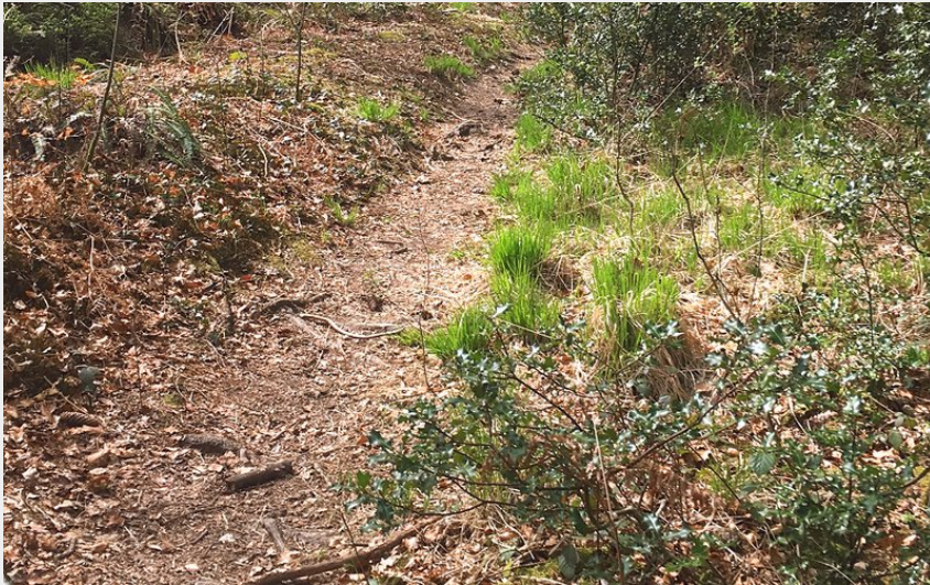
Sentiers de la forêt domaniale des Andaines (Tourisme 61)