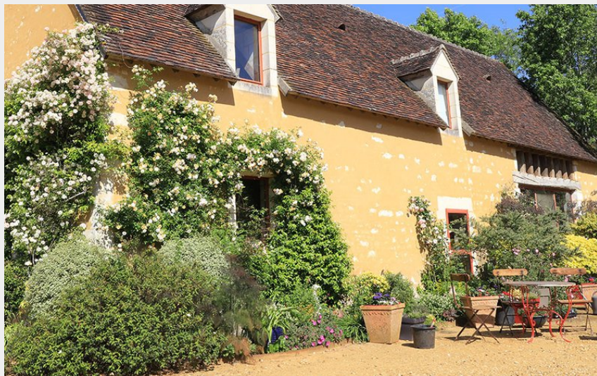
Jardin François