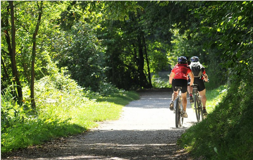
A VTT dans l'Orne