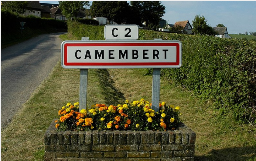
Village de Camembert (D. Commenchal)