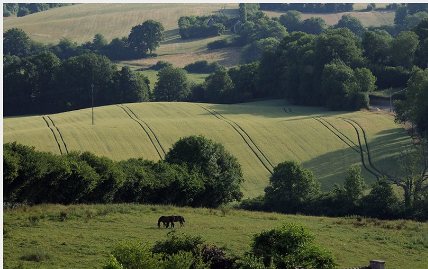
Paysage du Perche (D. Commenchal)