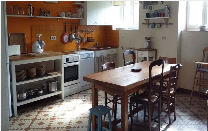
Crédit photo : La-Ferme-Buissonniere-La-Lande-de-Louge (© MME PECCATTE)