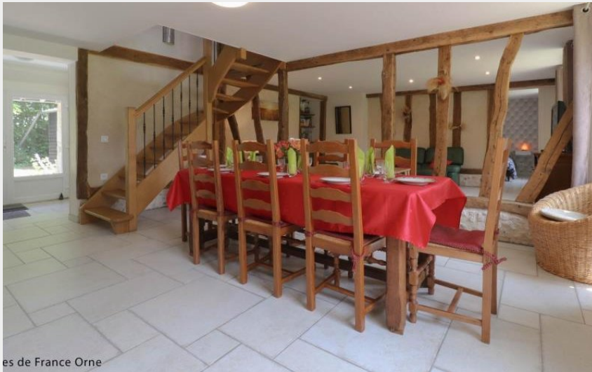
es de France Orne