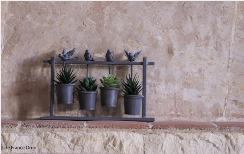
s de France Orne