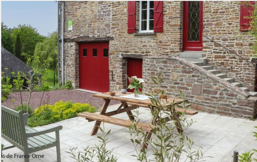
Gîtes de France Orne

Crédit : Gîtes de France Le Chalet des Roches (© Gîtes de France Orne)