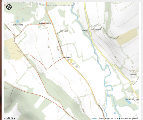
Crédit : Gîtes de France La Maison des Racines & spa (© Gîtes de France Orne)