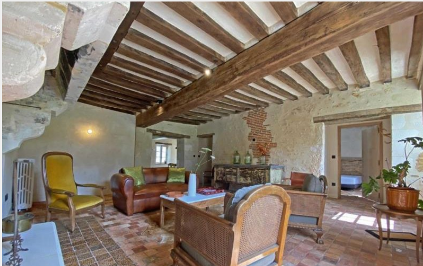
Crédit : Gîtes de France Ferme de La Porte (© Gîtes de France Orne)