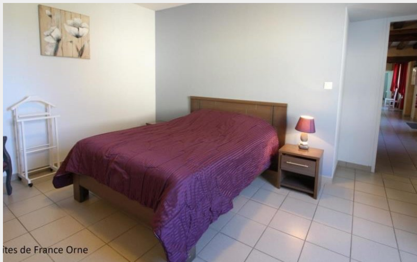
Gites de France Orne

Crédit photo : Le Vieux Moulin (© Gites de France Orne)