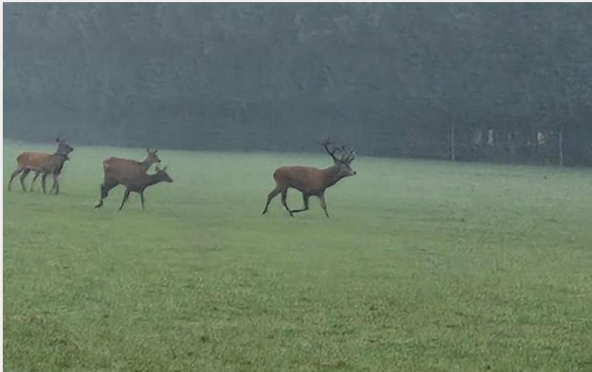
Crédit : Gîtes de France L'Hotellerie du Brâme (© Gites de France Orne)