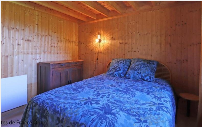
Gîtes de France Orne