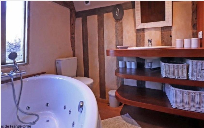
Gîtes de France Orne