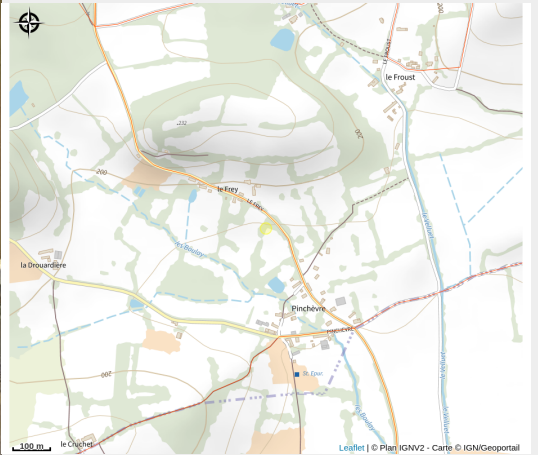
Gîte de Pinchèvre