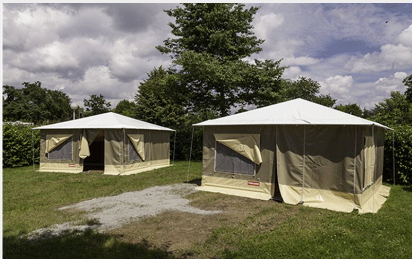
Crédit photo : decouvrir-camping-guerame2 800x600 (©Camping Guéramé)