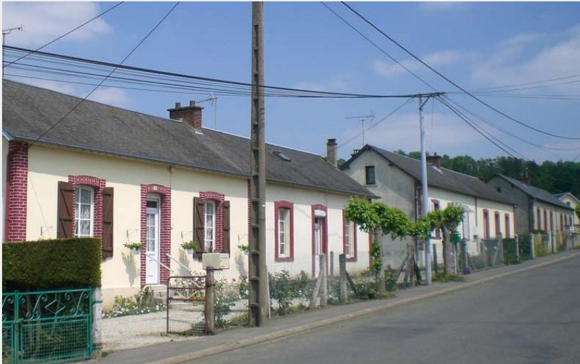
Cité du Gué Plat - La Ferrière aux Etangs