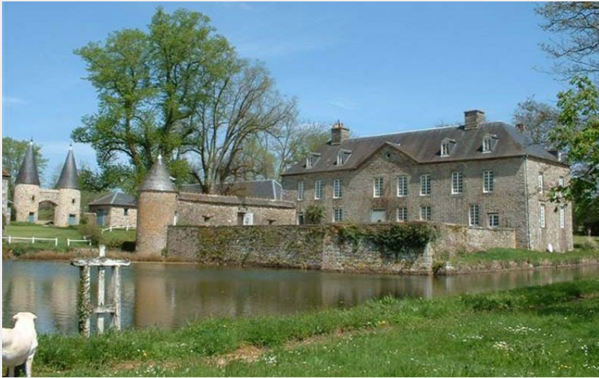
Manoir de la Guyardière - La Haute Chapelle