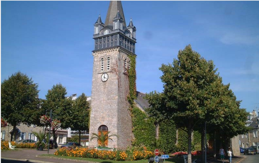
Eglise Ste Madeleine - Bagnoles de l'Orne