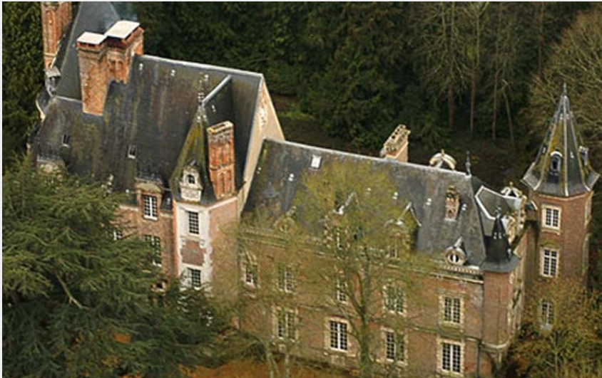
Crédit photo : Château du Fontenil - St Sulpice sur Risle (©P. Lherminier)