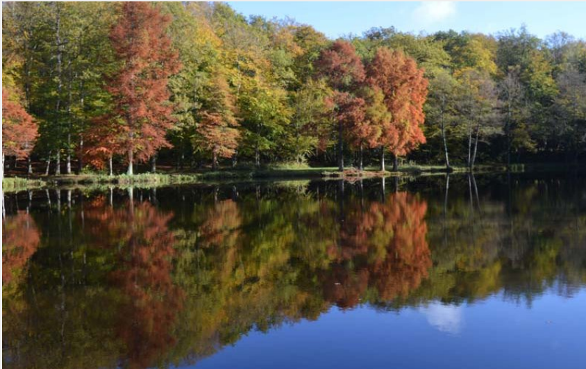
Site de la Herse - Eperrais