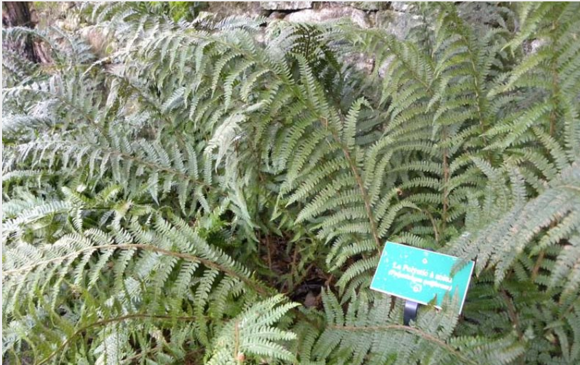
Jardin botanique - La Perrière