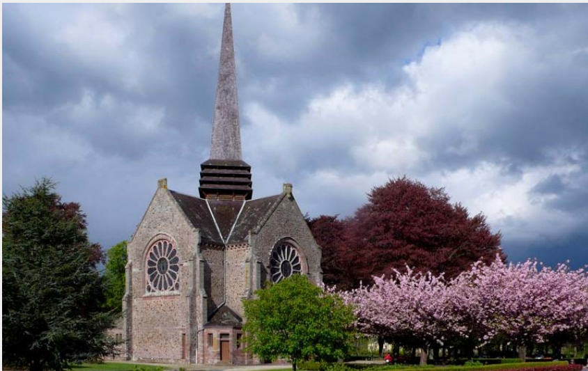
Chapelles de l'Oratoire - Passais la Conception