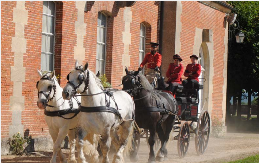
Crédit photo : Haras national du Pin - Le Pin au Haras (©N. Gondouin)