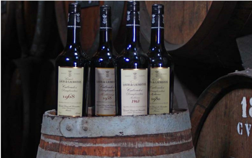
Calvados Comte Louis de Lauriston - Domfront