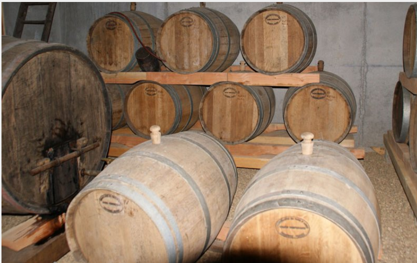
Cidrerie Traditionnelle du Perche - Le Theil sur Huisne