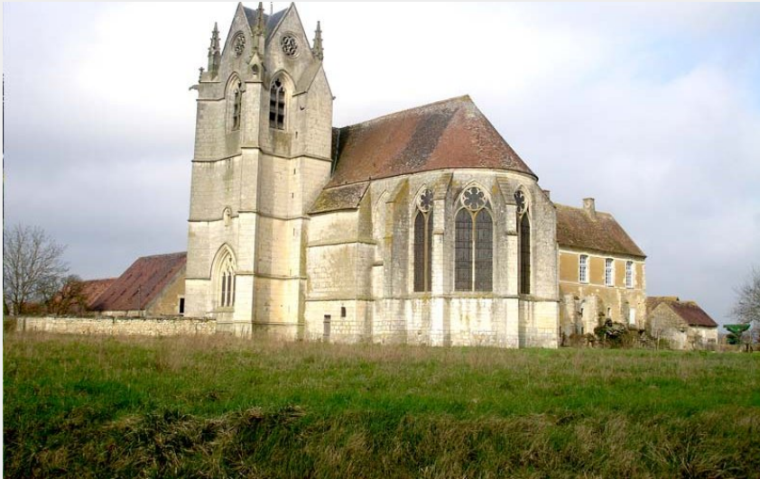
Crédit photo : Prieuré Ste Gauburge - St Cyr la Rosière (© Ome Tourisme)