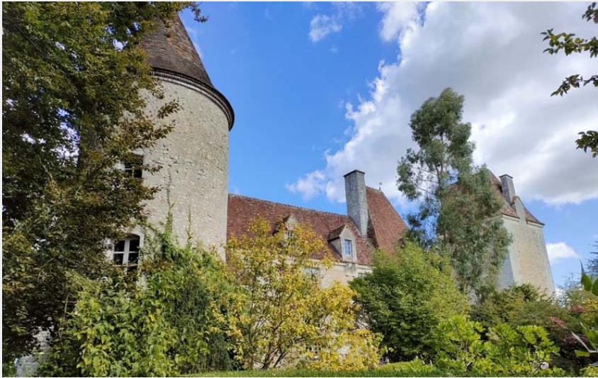
Les jardins des Perrignes - Saint-Maurice-sur-Huisne