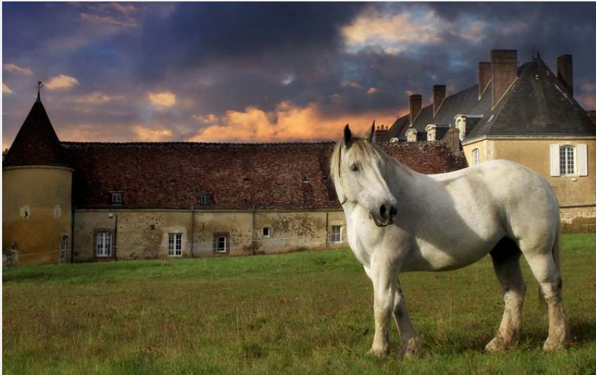
Château de L'Hermitière - Val au Perche