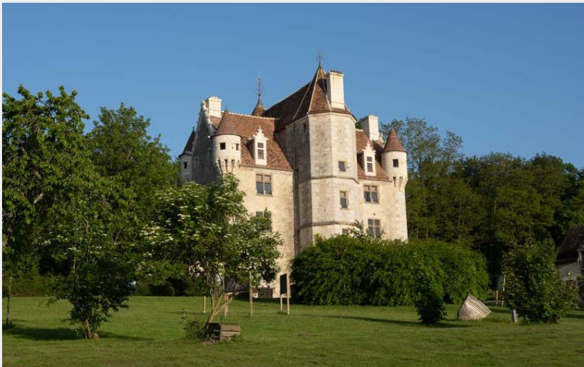
Domaine et manoir de Courboyer - Nocé