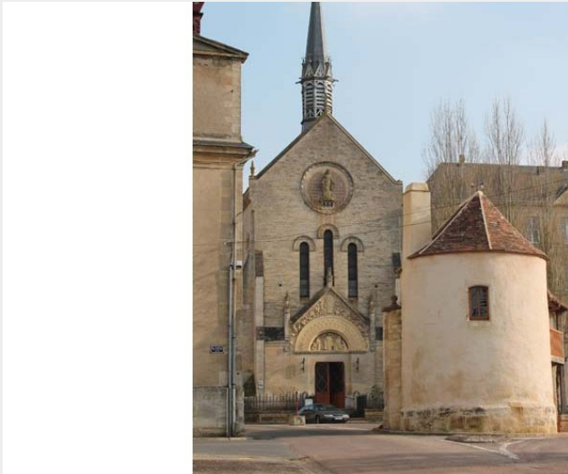
Basilique de l'Immaculée Conception - Sées