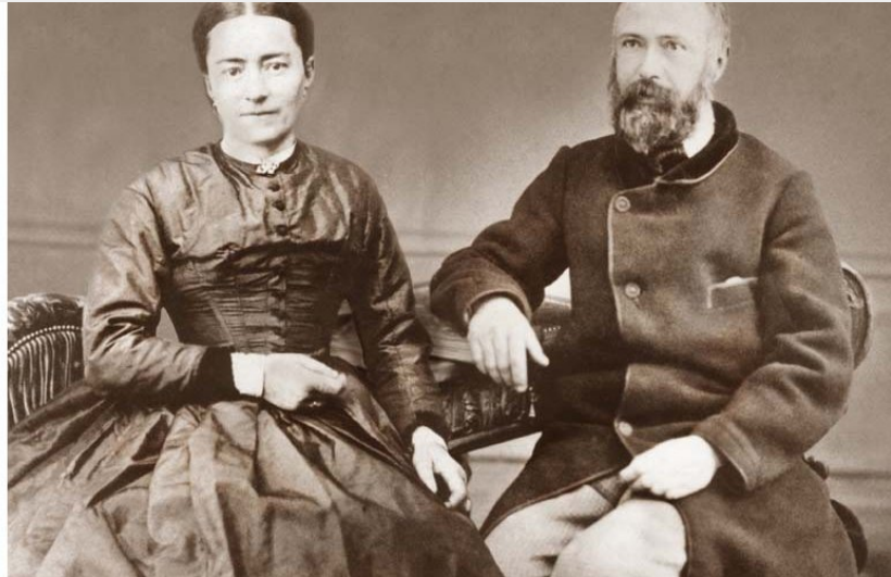
Saints Louis et Zélie Martin - Sanctuaire d'Alençon