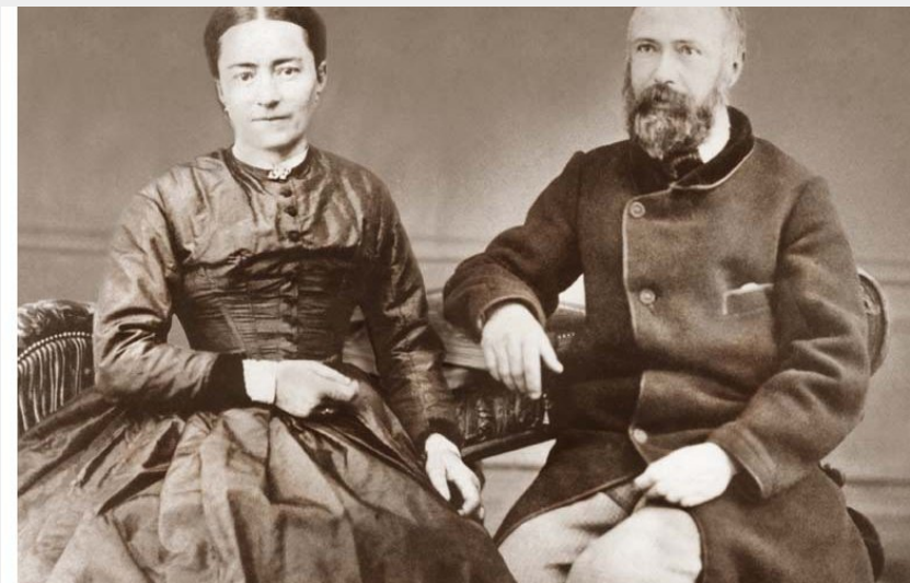
Crédit photo : Saints Louis et Zélie Martin - Sanctuaire d'Alençon (©Sanctuaire d'Alençon)