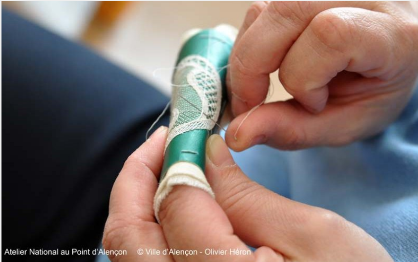
Atelier National au Point d'Alençon