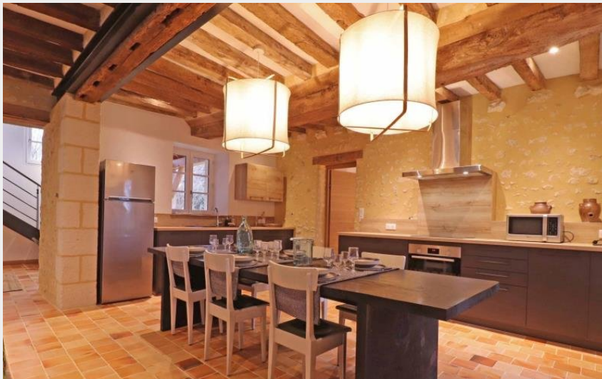
Crédit photo : Grand gîte du Bistrot des Ecuries (© Gites de France Orne)