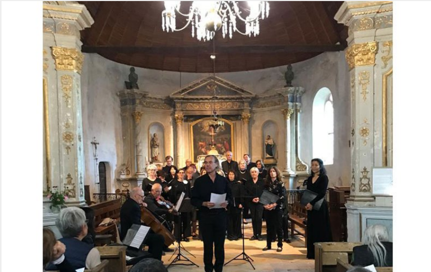
Crédit photo : Stage de chant Masterclass de Val au Perche (Cipriani Lorenzo 2023)