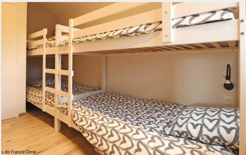
s de France Orne