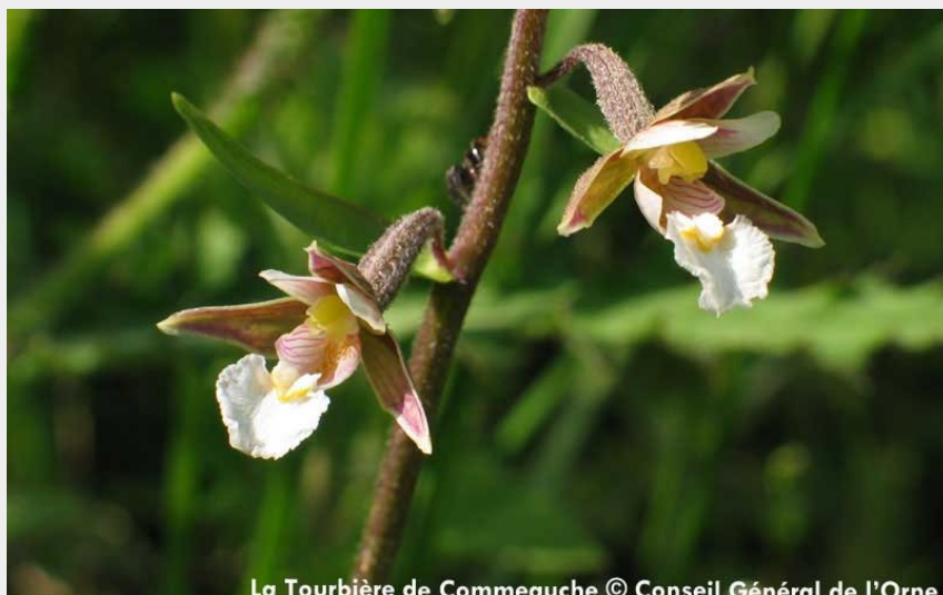
La Tourbière de Commeauche