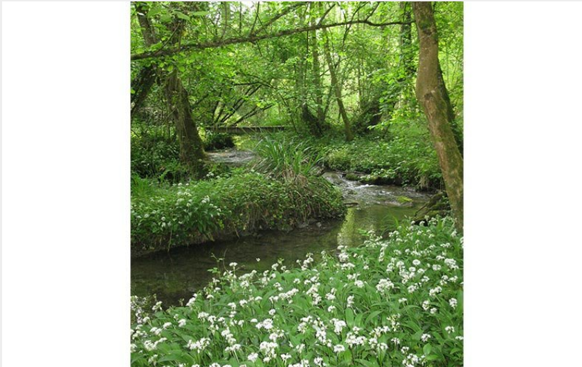
Le Vaudobin et les gorges du Meillon