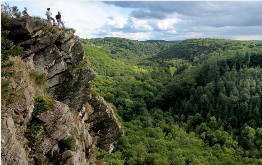
La Roche d'Oëtre - Suisse Normande