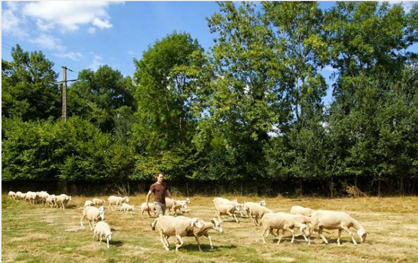
Crédit photo : Brebis d'Ecouves - St Nicolas des Bois (©Brebis d'Ecoves)