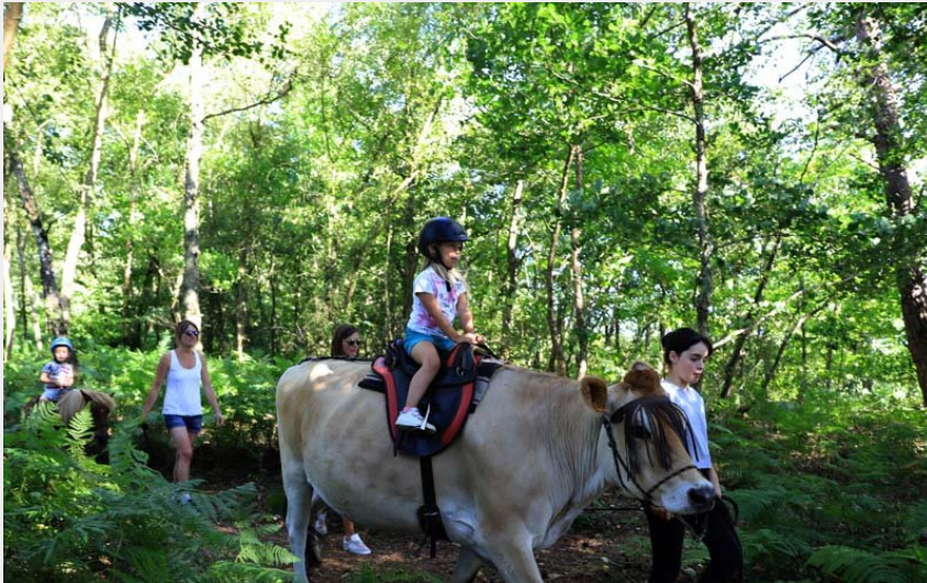
4 Pat'Balad - St Philbert sur Orne