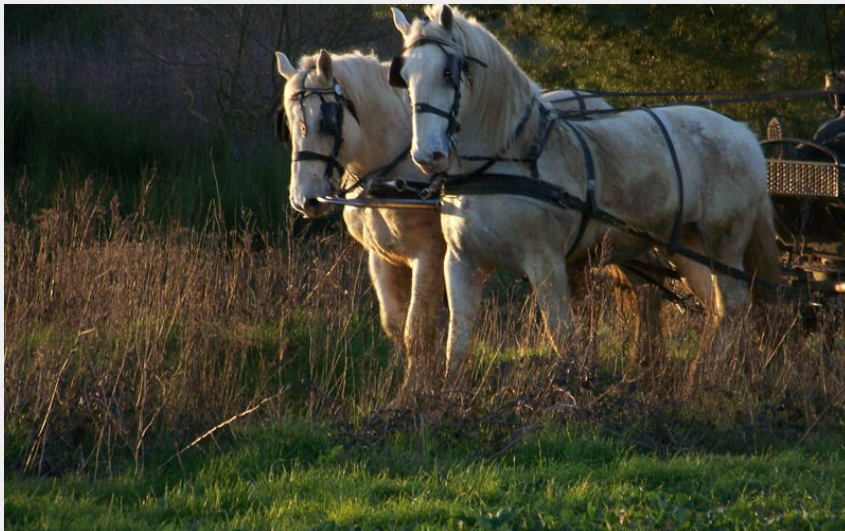
Attelage naturaliste dans le Perche