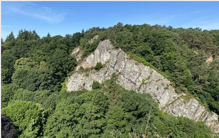
Tertre Sainte Anne - Domfront