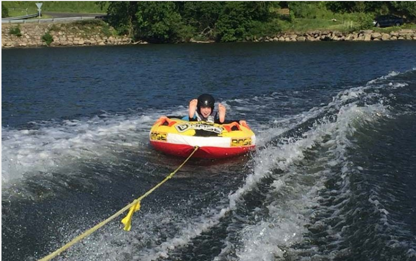
Crédit photo : Motonautisme en Suisse Normande - Putanges le Lac (©MCBN)