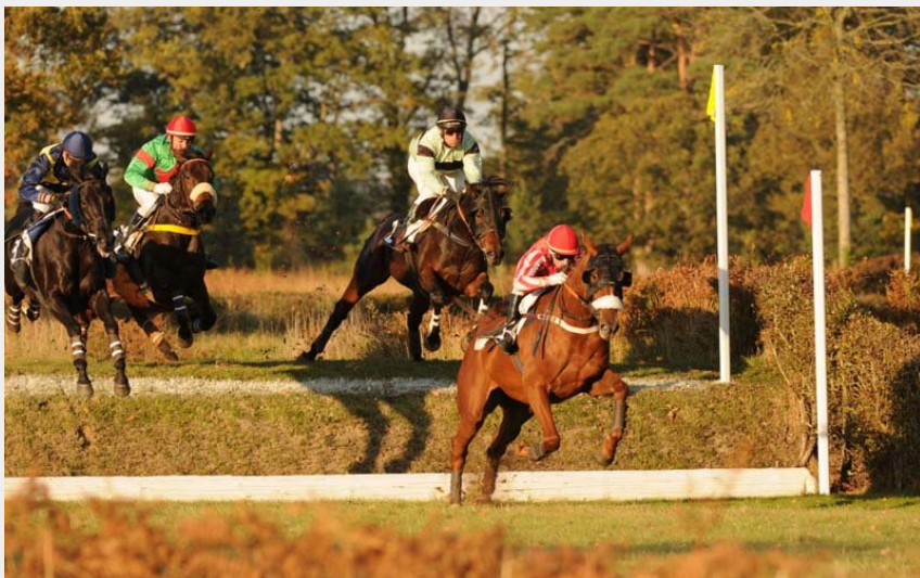
Hippodrome de la Bergerie