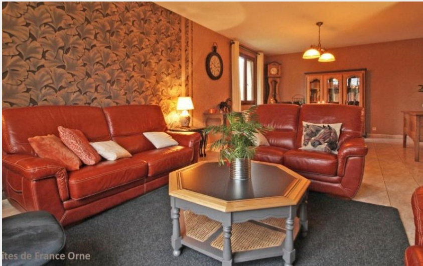
Gîtes de France Orne